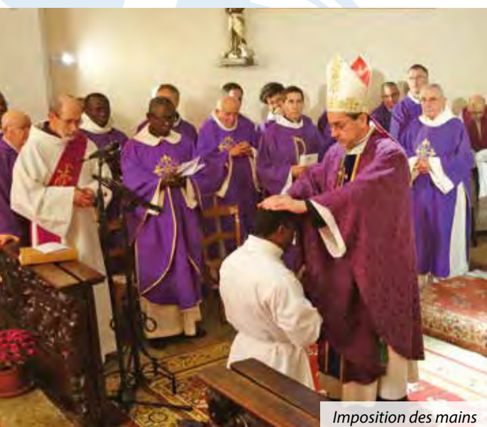
Imposition des mains

Le diacre, dans l'Église, est un ministre ordonné pour rappeler à tous les chrétiens la vocation de toute l'Église au service, à servir plutôt qu'à être servi.