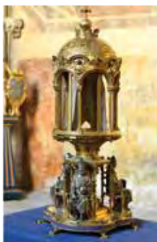
Reliquaire et Sainte Coiffe