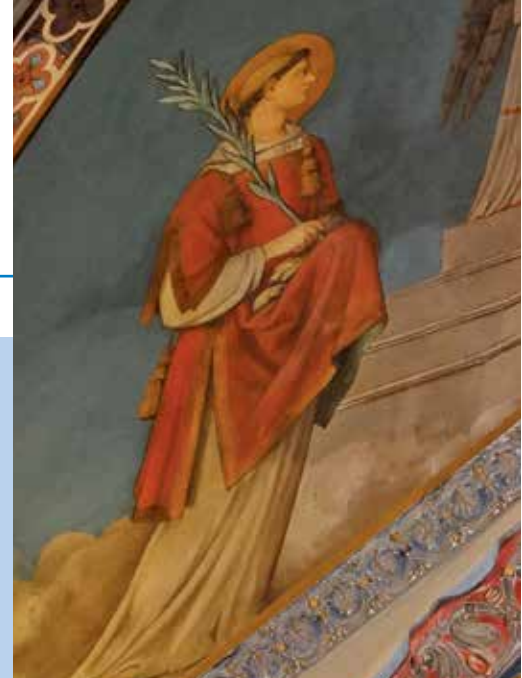
St Etienne premier martyr (Chapelle de la Vierge)

Construite il y a 900 ans, la cathédrale de Cahors est une des églises à coupoles du sud-ouest de la France. Prouesse de l'art roman, située au carrefour des routes d'Agen, de Rodez et de Toulouse, elle est une étape importante sur le chemin de Compostelle. Au Moyen-Age, les pèlerins y venaient en nombre vénérer une relique de la Passion du Christ, la Sainte Coiffe. Un linge mortuaire qui aurait recouvert le visage de Jésus dans son tombeau après la crucifixion.