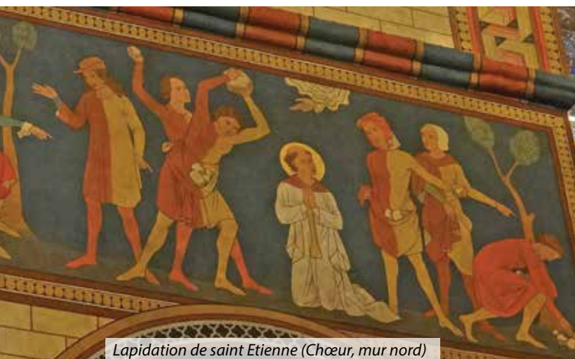
Lapidation de saint Etienne (Chœur, mur nord)

Sa foi entraînera sur le chemin de Damas la conversion de Saul de Tarse, connu sous le nom de saint Paul. On ne sait pas grand-chose de sa vie, de sa conversion. Il est célébré chaque 26 décembre dans l'Église catholique.