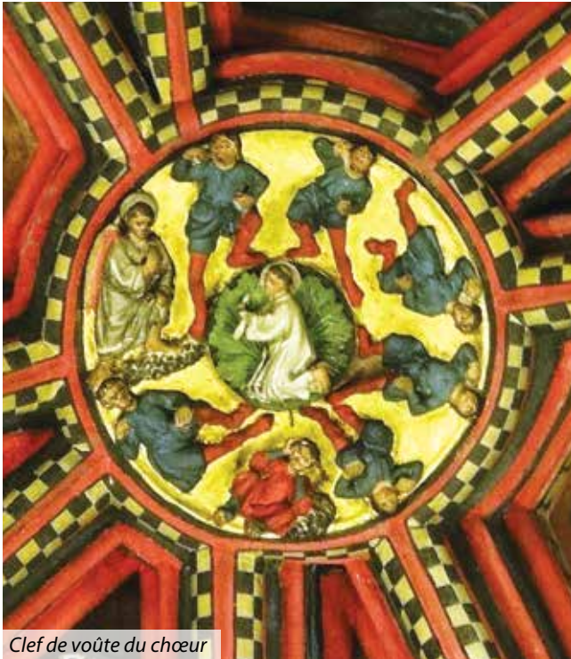
Clef de voûte du chœur