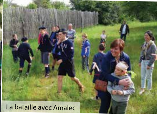
La bataille avec Amalec