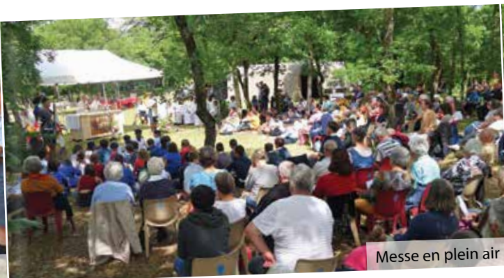
Messe en plein air