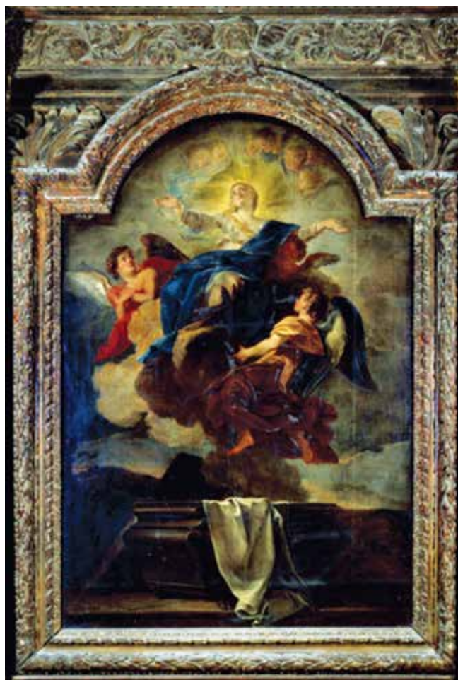
Cahors - Cathédrale Saint Etienne Chapelle ND - XVII ème siècle.

Ce n'est que le 1 er novembre 1950 que l'Assomption de la Vierge Marie est devenue un dogme (= vérité de foi) de l'Eglise catholique, décrété par le Pape Pie XII, dans la Constitution apostolique Munificentissimus Deus : « Par l'autorité de Notre-Seigneur Jésus-Christ, des bienheureux apôtres Pierre et Paul, et par Notre propre autorité, Nous prononçons, déclarons, et définissons comme un dogme divinement révélé que l'Immaculée Mère de Dieu, la Vierge Marie, après avoir achevé le cours de sa vie terrestre, fut élevée corps et âme à la gloire céleste » - Constitution dogmatique Munificentissimus Deus , § 44.