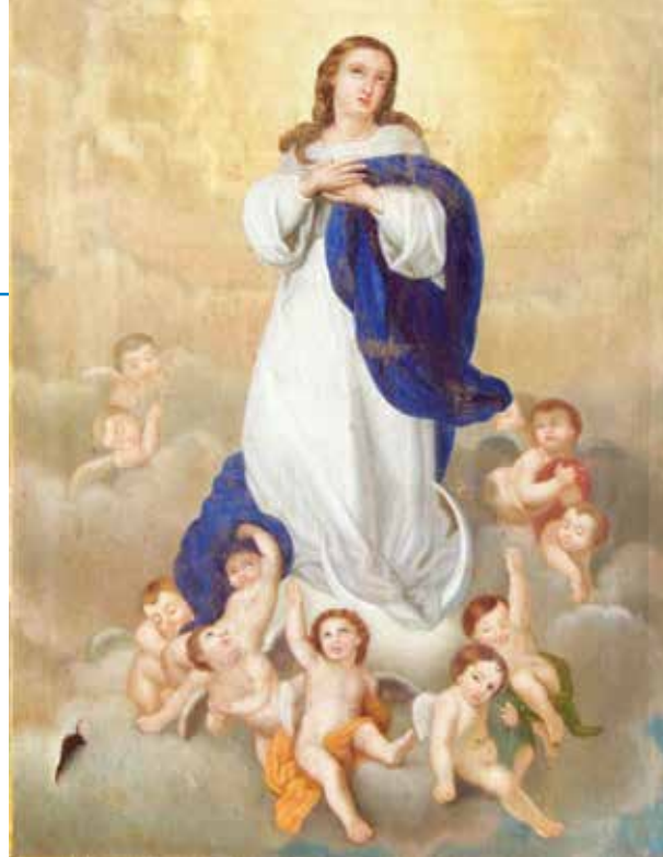
Le Vignon en Quercy (Martel) - XVIII ème siècle