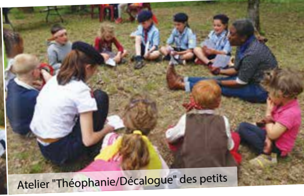
Atelier "Théophanie/Décalogue" des petits