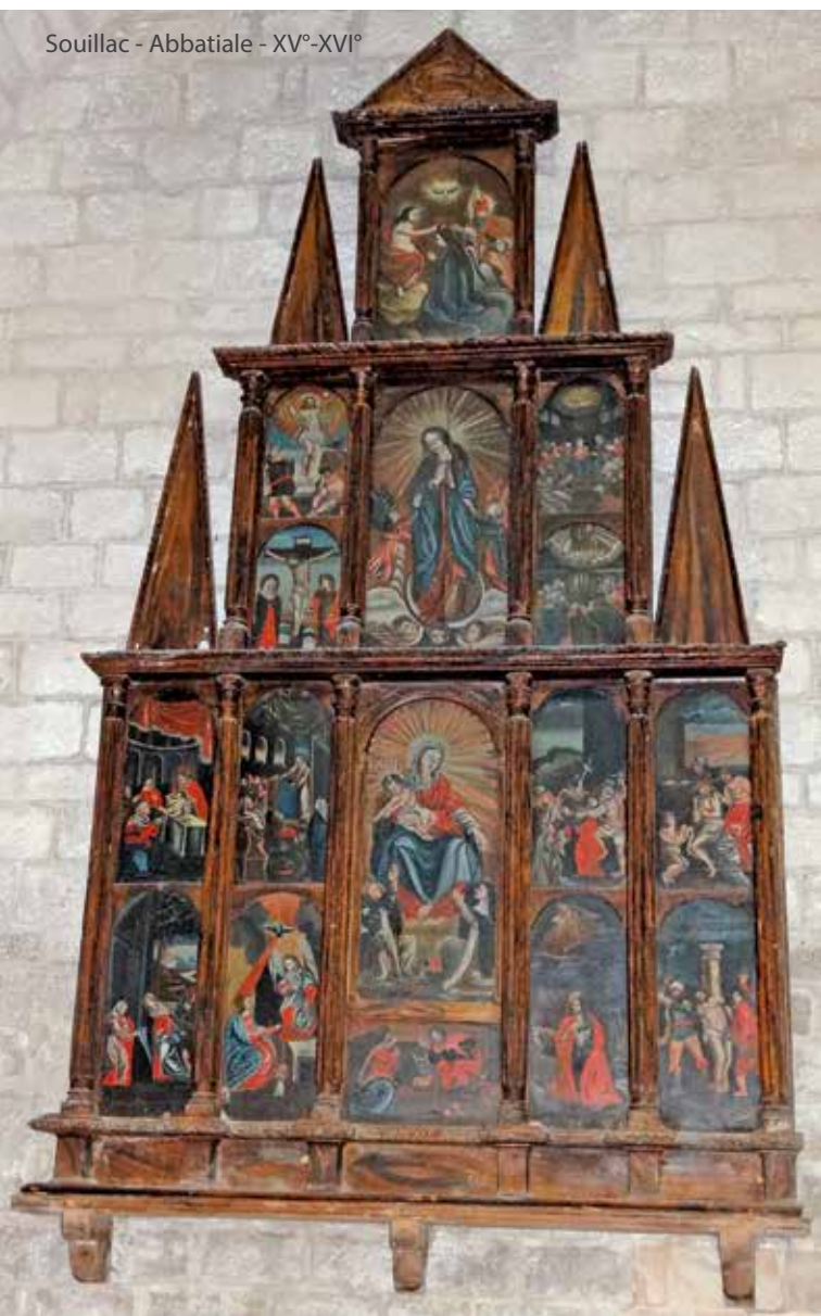
Souillac - Abbatale - XV o -XVI o

En 1964, le Concile Vatican II, par la constitution dogmatique Lumen Gentium du Saint Pape Paul VI, a énoncé : « Enfin, la Vierge immaculée, préservée de toute tâche de la faute originelle, au terme de sa vie terrestre, fut élevée à la gloire du ciel en son âme et en son corps et elle fut exaltée par le Seigneur comme Reine de l'univers afin de ressembler plus parfaitement à son Fils, Seigneur des seigneurs et vainqueur du péché et de la mort. » - Constitution dogmatique Lumen Gentium sur l'Eglise, § 59.