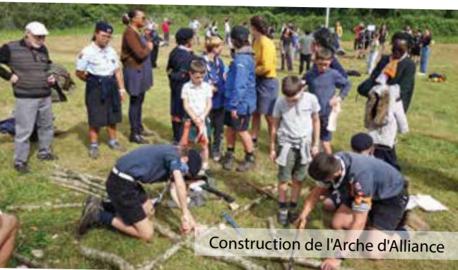
Construction de l'Arche d'Alliance