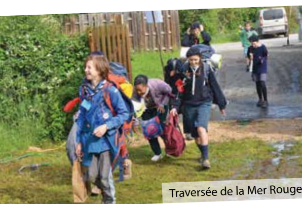
Traversée de la Mer Rouge