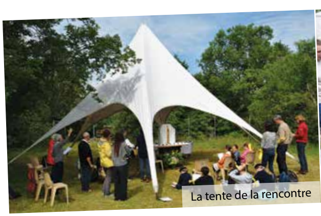
La tente de la rencontre