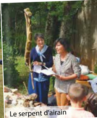
Le serpent d'airain