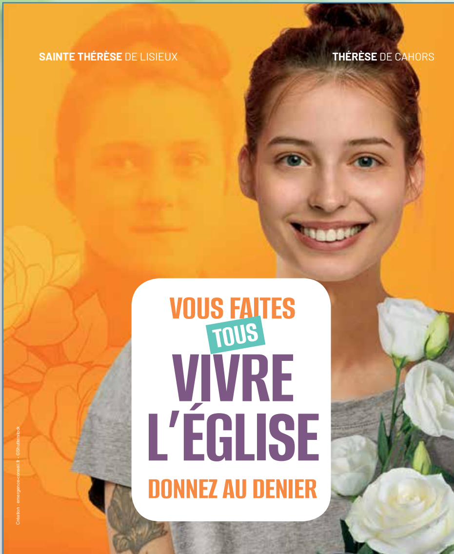
SAINTE THÉRÈSE DE LISIEUX

VOUS FAITES TOUS VIVRE L'ÉGLISE DONNEZ AU DENIER