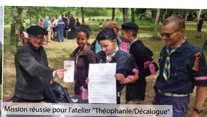
Mission réussie pour l'atelier "Théophanie/Décalogue"