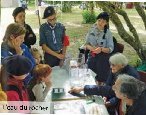
L'eau du rocher