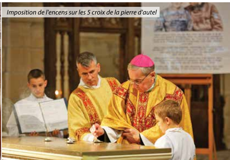
Imposition de l'encens sur les 5 croix de la pierre d'autel