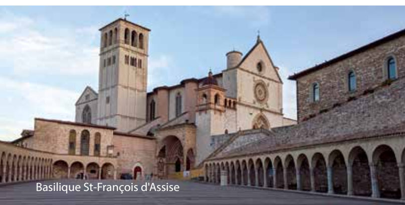
Basilique St-François d'Assise