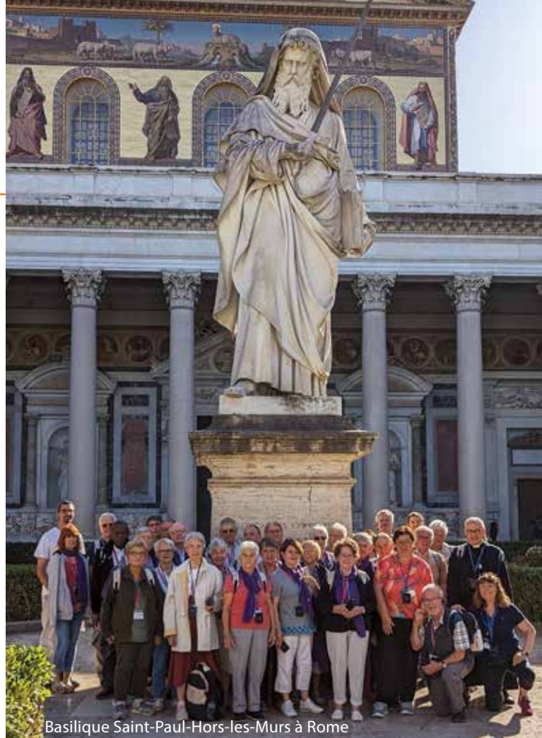
Basilique Saint-Paul-Hors-les-Murs à Rome

Ce miracle de la relation, nous l'avons vécu par les prières communes, la récitation du chapelet, les cantiques de louange et les chants à Marie entonnés dans le car. Nous l'avons vécu si intensément au travers