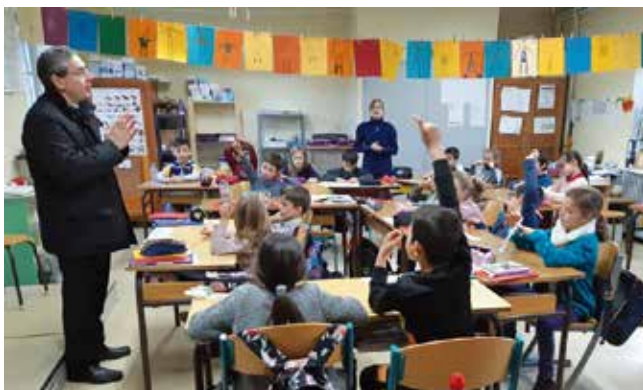
Groupement paroissial de Figeac Visite pastorale du 11 au 16 décembre 2018

a) Accompagnement et discernement pastoral : partons du principe que l'Esprit Saint est l'acteur principal de la mission de l'Église. Il nous précède dans le cœur de tout homme et dans les réalités fraternelles de l'Église locale et de ce monde. La fraternité ne se décrète pas, mais elle apparaît et demande à être accompagnée pour grandir dans l'amour et surmonter la violence due à nos failles relationnelles, au péché et à l'égoïsme. Comment former davantage de personnes à accompagner et à soutenir nos fraternités locales missionnaires et à accompagner les personnes en fragilité ou dont la foi se cherche (catéchumènes, recommençants...), dont le chemin personnel et familial a besoin de soutien (fiancés, familles recomposées, blessés de la vie) ? Il existe une forte attente d'accompagnement, pour les prêtres eux-