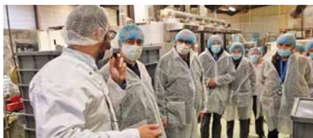
Groupement Paroissial de Cahors Visite Pastorale du 18 au 24 octobre 2021

d) Pastorales des familles, des jeunes et des vocations : l'intergénérationnel doit être davantage mis en œuvre dans nos événements pastoraux. L'animation de groupes d'enfants et d'adolescents par de grands jeunes (accompagnés par des adultes), la place des parents dans la catéchèse ou l'accompagnement des servants d'autel, mais aussi les collaborations à développer entre les jeunes adultes et les plus anciens dans la liturgie comme dans les instances de décision paroissiale est à développer. Chacun a sa place dans l'Église, cela nous encourage sans cesse à appeler de nouvelles personnes capables de transmettre et non de s'installer dans une fonction accaparée, de solliciter d'autres évangélistes, de développer une culture vocationnelle, comme le faisait saint Paul lorsqu'il écrivait à Timothée : « Toi donc, mon enfant, fortifie-toi dans la grâce qui est en Jésus Christ. Et ce que tu as entendu de moi en présence de beaucoup de témoins, confie-le à des hommes fidèles, qui soient capables de l'enseigner aussi à d'autres » (2 Tim 2,1-2).