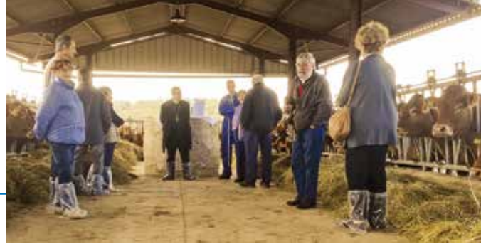
1 ère visite pastorale au groupement paroissial de Gourdon du 13 au 18 novembre 2018

A partir de novembre 2018, j'ai entrepris une tournée du diocèse assez approfondie, m'attardant à loger pendant plusieurs jours dans dix-neuf groupements paroissiaux, le plus souvent au presbytère. J'ai rencontré les paroissiens mais aussi les élus locaux, des acteurs économiques ou sociaux, des agriculteurs, des personnes handicapées, malades ou âgées, des membres d'associations culturelles ou sportives, etc. La pandémie de Covid-19 a ralenti mon rythme, les quatre derniers groupements paroissiaux visités l'ayant été à des dates plusieurs fois repoussées. Au lieu de finir en septembre 2020, le groupement paroissial de Vayrac a dû voir réduire ma visite à une seule journée le 9 mai 2021 et je n'ai finalement terminé mon circuit qu'en octobre 2021. Il est temps, après trois ans sous cette formule, d'envisager d'autres manières de continuer à être proche et à l'écoute du peuple de Dieu sur tout le territoire du Lot, en particulier en s'appuyant sur les fruits à venir de la démarche synodale convoquée par le pape François. Mais je souhaite faire déjà une synthèse de ce que j'ai vécu et perçu pendant ces nombreuses rencontres.