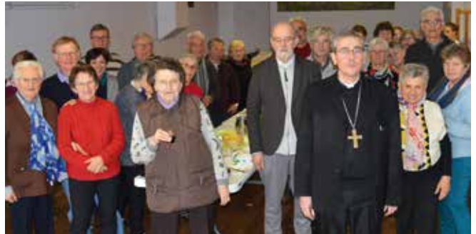
Groupements paroissiaux Saint-Céré et Sousceyrac Visite pastorale du 13 au 17 mars 2019

programmes de chaque visite et les comptes-rendus que j'ai fait au début de la messe du dimanche, au dernier jour de chaque visite.