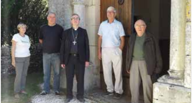
Groupement paroissial de Cours, St-Géry, Vers Visite pastorale du 12 au 15 septembre 2019