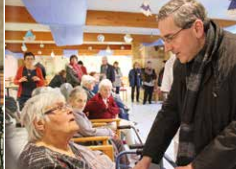
Groupement paroissial de Catus-Cazals Visite pastorale du 14 au 19 janvier 2020

mêmes, pour les laïcs en mission, les membres des EAP, les catéchistes et animateurs, mais aussi chez des personnes pas ou peu engagées dans l'Église. Parfois cette attente s'exprime uniquement par des demandes de bénédiction, d'encouragement, de réconfort : dites-moi que je fais bien ! L'enjeu de l'accompagnement est d'aider à saisir qu'il y a des discernements à opérer, des choix à poser, des actes courageux à développer. Comment répondrons-nous à ce besoin ?