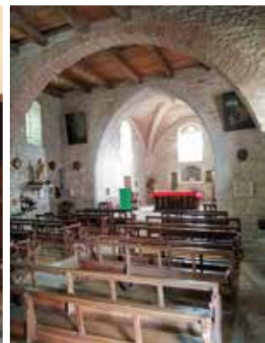
Pradines, église St Martial