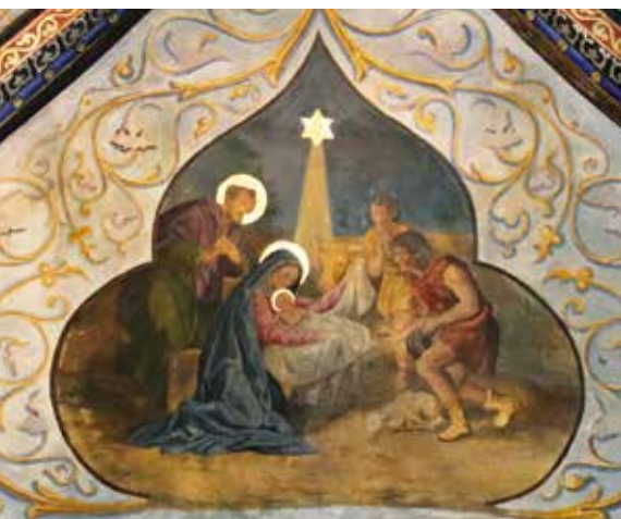
Adoration des bergers. Peinture murale de l'église St Barthélemy à Cahors.