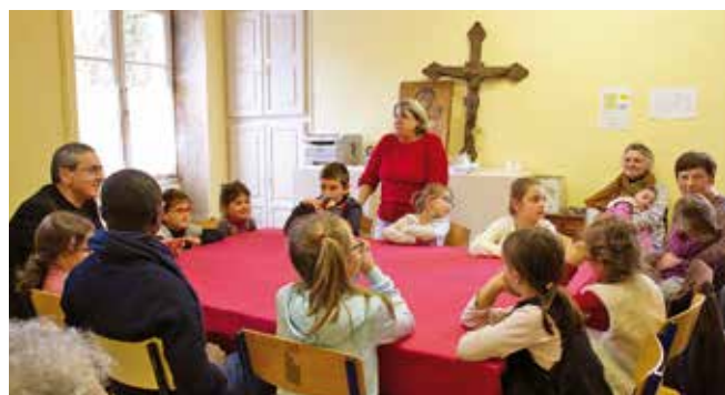
Groupement paroissial de Cajarc Visite pastorale du 11 au 16 février 2020

mêmes, pour les laïcs en mission, les membres des EAP, les catéchistes et animateurs, mais aussi chez des personnes pas ou peu engagées dans l'Église. Parfois cette attente s'exprime uniquement par des demandes de bénédiction, d'encouragement, de réconfort : dites-moi que je fais bien ! L'enjeu de l'accompagnement est d'aider à saisir qu'il y a des discernements à opérer, des choix à poser, des actes courageux à développer. Comment répondrons-nous à ce besoin ?