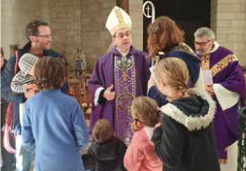
Groupement paroissial de Montcuq Visite pastorale du 10 au 15 décembre 2019