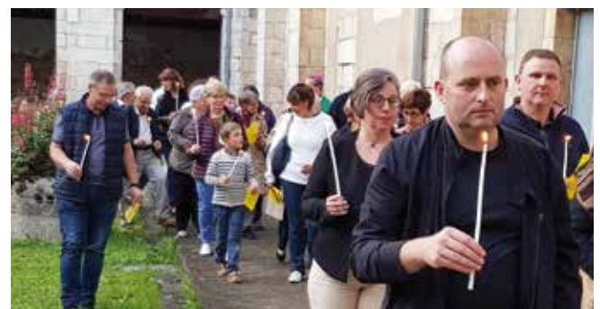
Groupement paroissial de Souillac Visite pastorale du 11 au 16 juin 2019

Les nombreuses visites de réalités humaines sur l'ensemble du territoire lotois m'ont donné une « photographie » originale du monde d'aujourd'hui . Dans chacune de ces rencontres, j'avais à l'esprit ces mots de saint Jean : « Dieu a tant aimé le monde qu'Il a donné son Fils unique, afin que quiconque croit en Lui ne se perde pas, mais obtienne la Vie éternelle » (Jn 3, 16) Dieu aime ce monde. Il a livré sa vie, son Fils unique, pour sauver ce monde. Pour essayer de rendre compte de ce regard sur le monde dans notre diocèse, j'ai rédigé une synthèse d'une dizaine de pages qui sera publiée dans un numéro spécial avec l'ensemble des articles déjà publiés sur les visites pastorales dans le bulletin diocésain ainsi que les