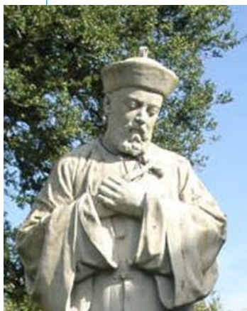
St Jean Gabriel Perboyre