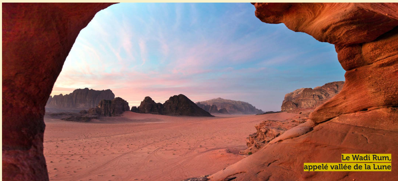
Le Wadi Rum, appelé vallée de la Lune

Messe en plein air dans les ruines de l'église byzantine sur le site de Pétra (prévoyez votre valise chapelle).