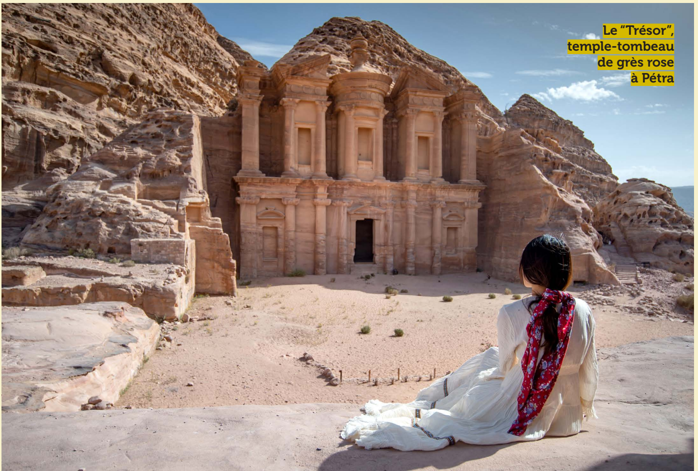
Le "Trésor", temple-tombeau de grès rose à Pétra

Déjeuner en cours de visite dans un restaurant sur le site.