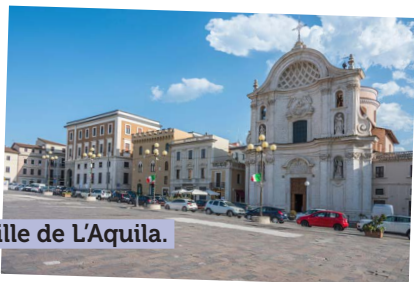
La ville de L'Aquila.