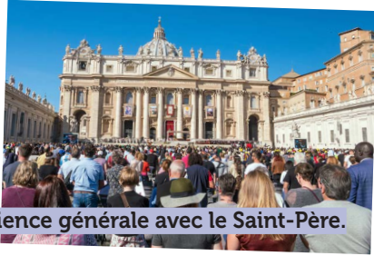
Audience générale avec le Saint-Père.

Le matin, nous nous rendrons à pied au Vatican pour un moment fort de communion au cœur de notre séjour à Rome, l'audience générale avec le Saint-Père (sous réserve) , qui nous a appelés à nous laisser transformer par l'amour du Christ, au cours de ce Jubilé qu'il a convoqué après la pandémie qui a frappé le monde et au moment où conflits, injustices, péchés et misères défigurent la Création et le cœur de l'Homme. "Pèlerins d'espérance", tout un programme. L'espérance, une flamme donnée aux chrétiens et qu'ils doivent garder allumée "pour que chacun", dit le pape François, "retrouve la force et la certitude de regarder l'avenir avec un esprit ouvert, un cœur confiant et une intelligence clairvoyante".