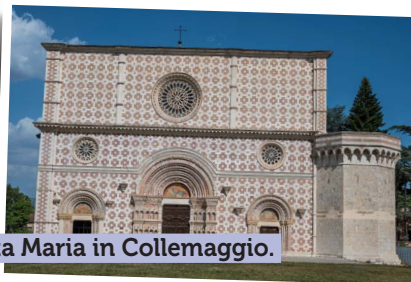
Santa Maria in Collemaggio.

Messe en la basilique Santa Maria in Collemaggio, où reposent les restes du saint pape aquilainais.