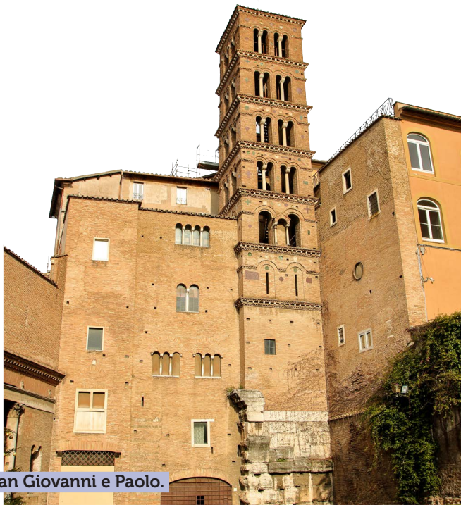
San Giovanni e Paolo.

sous le titre de Salus Populi Romani (salut du peuple romain), que la tradition attribue à saint Luc. Il a récemment déclaré qu'il souhaitait être inhumé à Sainte-Marie-Majeure.