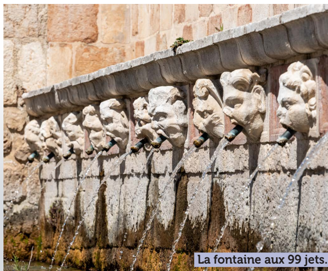
La fontaine aux 99 jets.

Découverte libre de la ville, récemment reconstruite après le tremblement de terre de 2009. Passage devant les 99 cannelles: la fontaine aux 99 jets est le monument le plus célèbre de la ville de L'Aquila. Construite en 1274 par l'architecte Tancredi da Pentima, elle fut le premier monument à être restauré après le tremblement de terre. La fontaine était à l'origine un lieu désigné comme lavoir public. La fontaine a en effet été construite dans la partie basse de la ville, près de