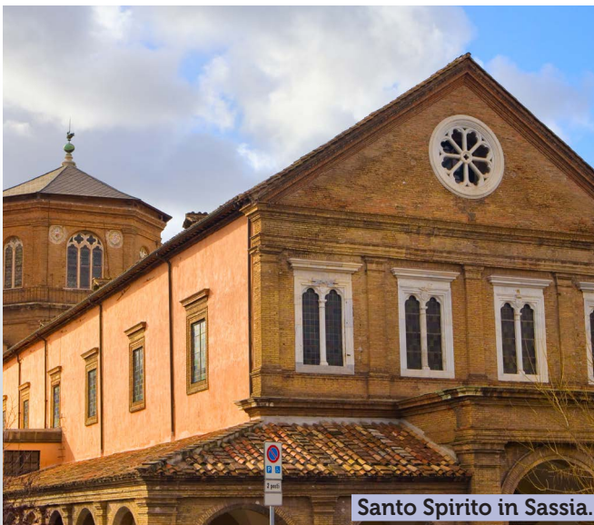
Santo Spirito in Sassia.

Construite à l'emplacement de l'ancienne basilique du IV e s. où, selon la tradition, se trouve la tombe de saint Pierre, la nouvelle basilique (23 000 m 2 , capacité de plus de 60 000 personnes), au cours des 120 ans de sa construction (1506-1626), a mobilisé des artistes renommés comme Bramante, Michel-Ange, Maderno, Le Bernin. Elle offre au regard des œuvres uniques, comme la Pietà de Michel-Ange ou le baldaquin du Bernin. "Tu es Pierre, et sur cette pierre je bâtirai mon Église." En ces jours bénis, nous rendons grâce à Dieu de nous conduire en ce lieu, mêlés aux pèlerins du monde entier, pour contempler le visage lumineux de notre Église fondée sur la profession de foi de Pierre : "Tu es le Christ, le Fils du Dieu vivant" (Mt 16, 16).