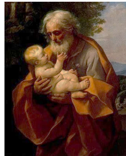
L'enfant et Joseph Guido Reni (1575 - 1642)