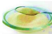
Sucre suivant les goûts