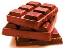
150g de chocolat noir