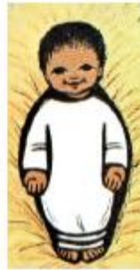
silhouette petit Jésus